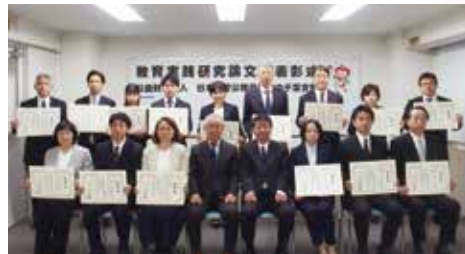
▲2023年度受賞者の皆様