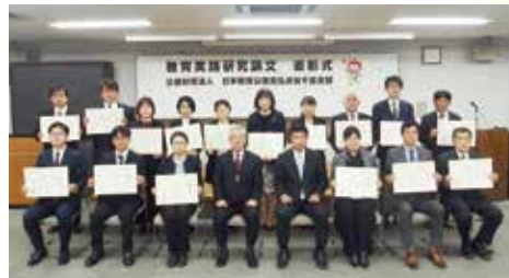
▲2022年度受賞者の皆様