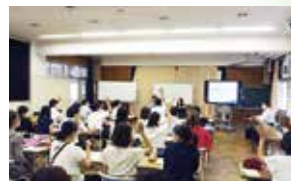
▲積極的に参加する教職員の方々