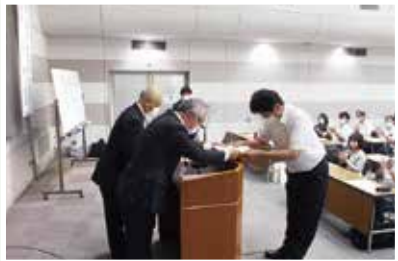
▲船橋地区 交付式の様子

千葉教弘では、有益な教育活動を行い、顕著な実績を上げている小・中・高・特別支援学校・幼稚園・こども園へ、研究助成金として毎年1校(園)10万円を助成しています。今年度は220校(園)が対象で、これまでに212校(園)に交付しました。研究助成金は、千葉県内の教育の発展・充実のために活用されています。千葉教弘は、頑張る教職員の皆様や未来ある子どもたちを応援しています。