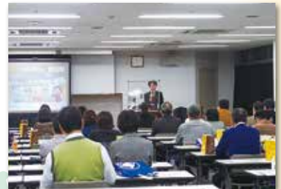
▲つどいの様子(千葉会場)

セミナーでは、多くの先生方が関心を持たれている、年金、介護、資産運用についてのお話をさせていただきました。今後、少子高齢化、人口の減少等が加速し、我々を取り巻く社会環境、経済環境は益々厳しさを増すことが予想されます。そのような時代に豊かなセカンドライフを送るためには、今まで以上の自助努力が必要となります。まずは、現状を知り、必要な情報を収集し、未来に対して備えることが大切です。我々は、先生方の、素晴らしいセカンドライフのお手伝いをさせていただきたいと考えています。