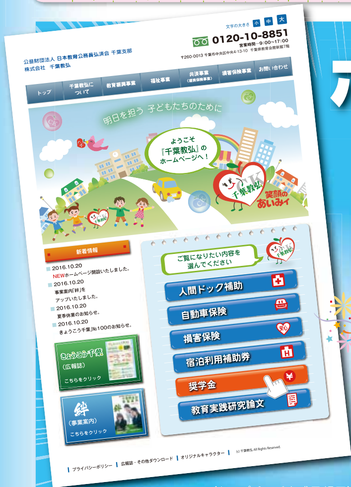
(トップページ完成予想図)