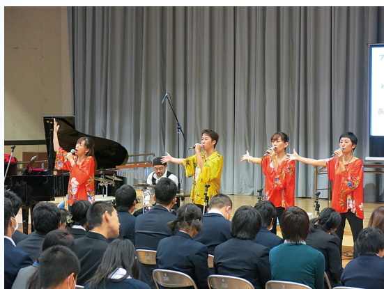
▲ チーム「絆」の皆さんによる歌と演奏

そして、いよいよチーム「絆」の皆さんによる歌と演奏が始まりました。オープニングは 勇気100%、そして アナと雪の女王「Let it go」と、子どもたちもよく知っている曲が続き、さらに、Smile、ジブリメドレーが歌われると会場は大いに盛り上がり、笑顔がいっぱい…。