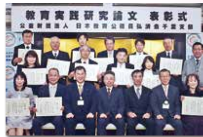
▲前年度受賞者の皆様

募集の詳細につきましては、裏面の要項をご覧ください。皆様のご応募お待ちしております。